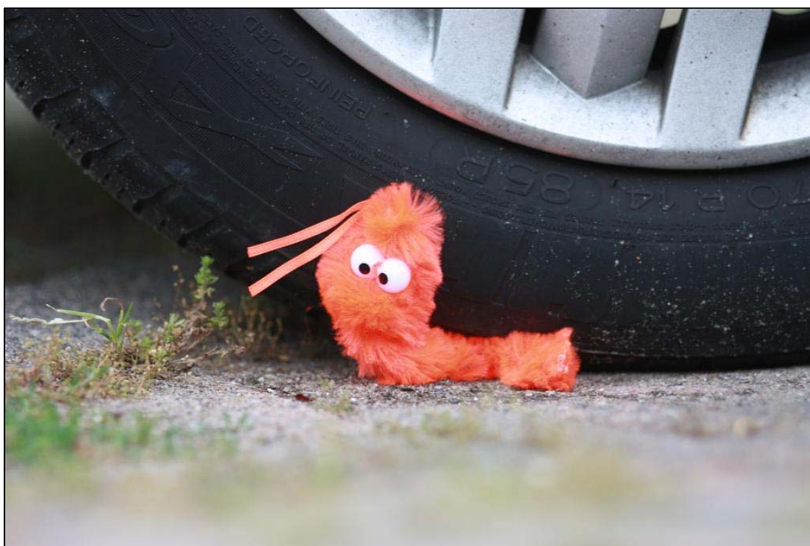
Verkeersslachtoffer dat sterk in aantal toeneemt...

Naast de categorie inheemse zoogdieren vallen ontsnapte exoten ook nog al eens ten prooi aan het verkeer. De soortenlijst van Flevoland telt daardoor enkele curieuze soorten: Amerikaanse nerts, Eland, Wasbeer en Wasbeerhond. De moraal van dit verhaal: Pas op voor beesies in het verkeer en geef slachtoffers door aan de zoogdieratlas.